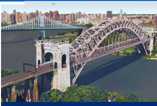
Las mejoras a la línea actual Hell Gate de Amtrak permitirán el servicio del Metro-North