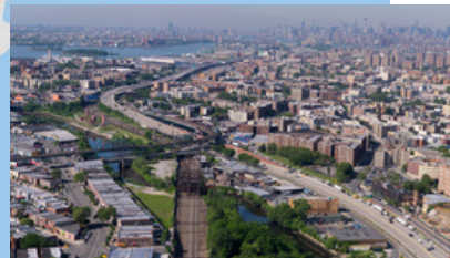
Conexiones regionales mejoradas en Penn Station a LIRR, NJ TRANSIT y Amtrak