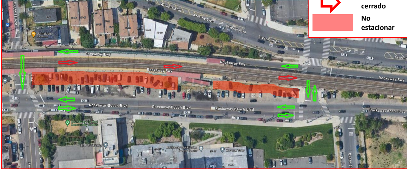
Mapa de áreas de actividades de construcción y cierres de calles cerca de la estación Beach 60th St.